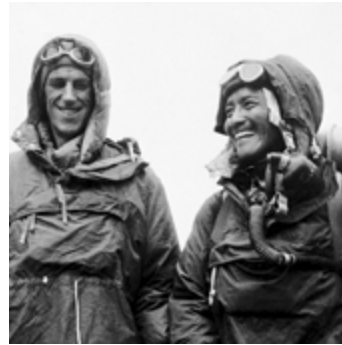
Edmund Hillary and Tenzig Norgay:

Πρωτοπόρος του Κινηματογράφου Η πρώτη γυναίκα σκηνοθέτης που κέρδισε Όσκαρ.