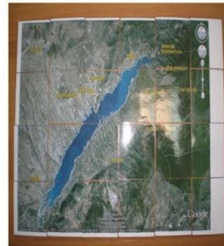
Παζλ «η λίμνη μας»