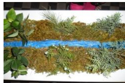
Μακέτα με πλαστελίνη και χόρτα. Παλιό χωμάτινο αυλάκι, με το οποίο πότιζαν οι παππούδες μας τα χωράφια τους.