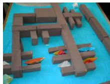
Η αποβάθρα στη λίμνη με άχρηστα κουτιά.