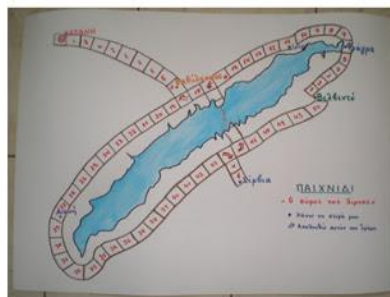
Ο γύρος της λίμνης