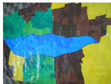
Η λίμνη μας. Κολλάζ με φύλλα γλασσέ.