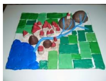
Το ποτάμι μας Ο Αλιάκμονας, με πλαστελίνη