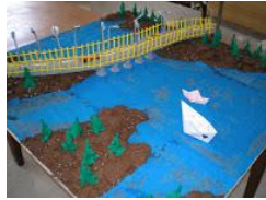
Η λίμνη μας και η γέφυρα